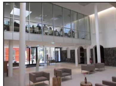
Lobby und Tagungsraum